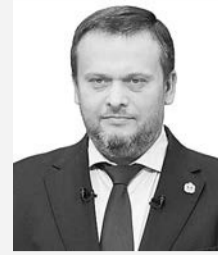
Андрей НИКИТИН, губернатор Новгородской области:

Андрей Никитин сообщил, что в Новгородской области откроется испытательный полигон для беспилотников. Его строительство ведётся