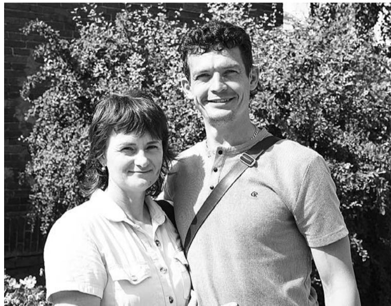
В спорте и в жизни – на одном дыхании

Познакомились они на свадьбе у друзей и поженились в Боровичах.