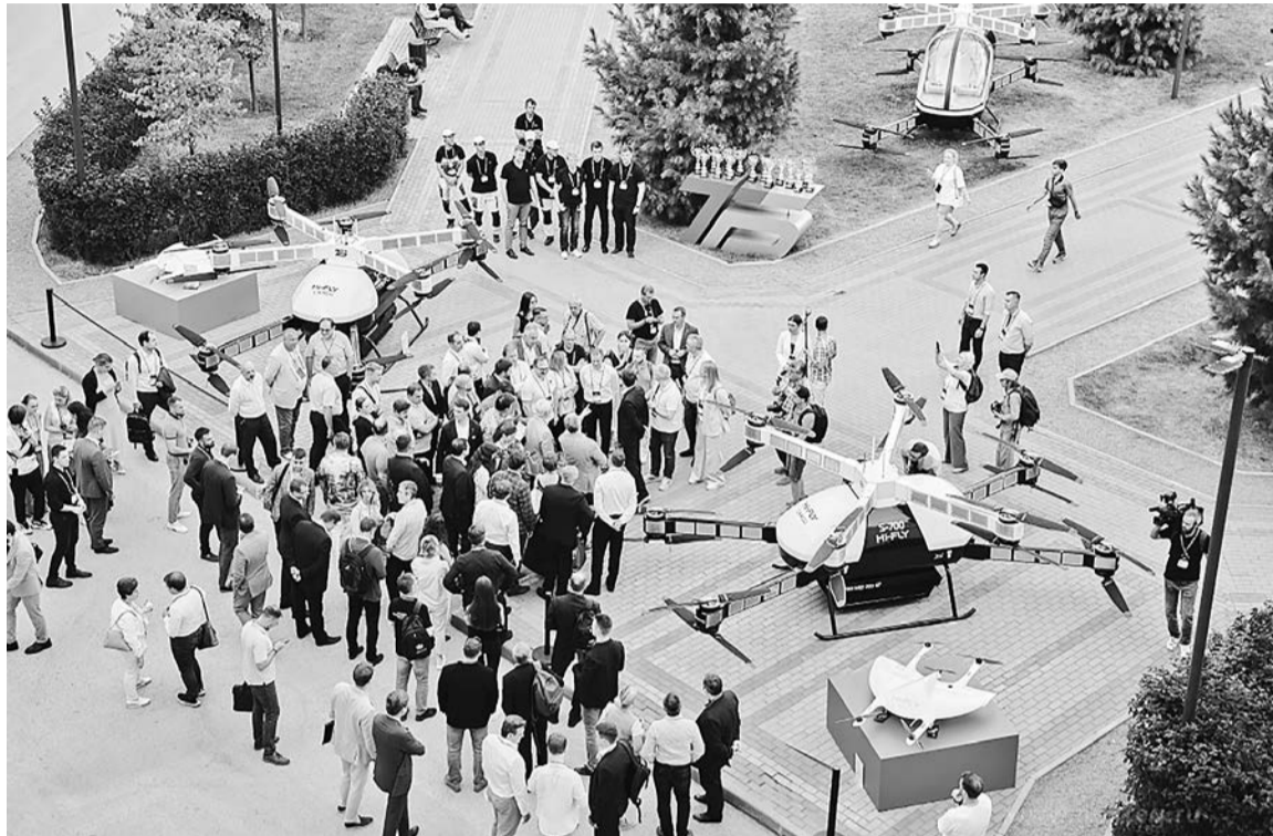
Новгородские проекты по перехвату управления и радиоэлектронной борьбе, представленные в Новосибирске, были оценены по достоинству

Новгородская область успешно выступила в проектно-образовательном интенсиве «Архипелаг-2023»